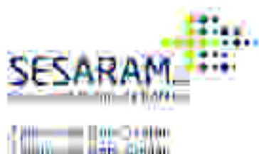
Tamanho mínimo com slogan