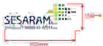
Tamanho mínimo sem slogan

No caso de outro sistema de reprodução em quadricomia ou vinilos deve verificar-se sempre uma verificação precisa da correspondência de cores.