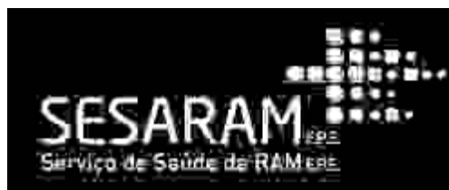
Logótipo em aplicação monocromática (negativo)