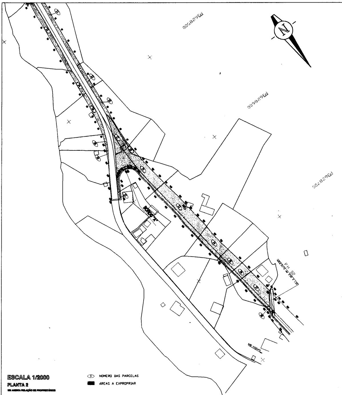
SECRETARIA REGIONAL DO EQUIPAMENTO SOCIAL E TRANSPORTES OBRA PÚBLICA DE CONSTRUÇÃO DA "VARIANTE À E.R. 104 - ROSÁRIO SÃO VICENTE - 1ª FASE"