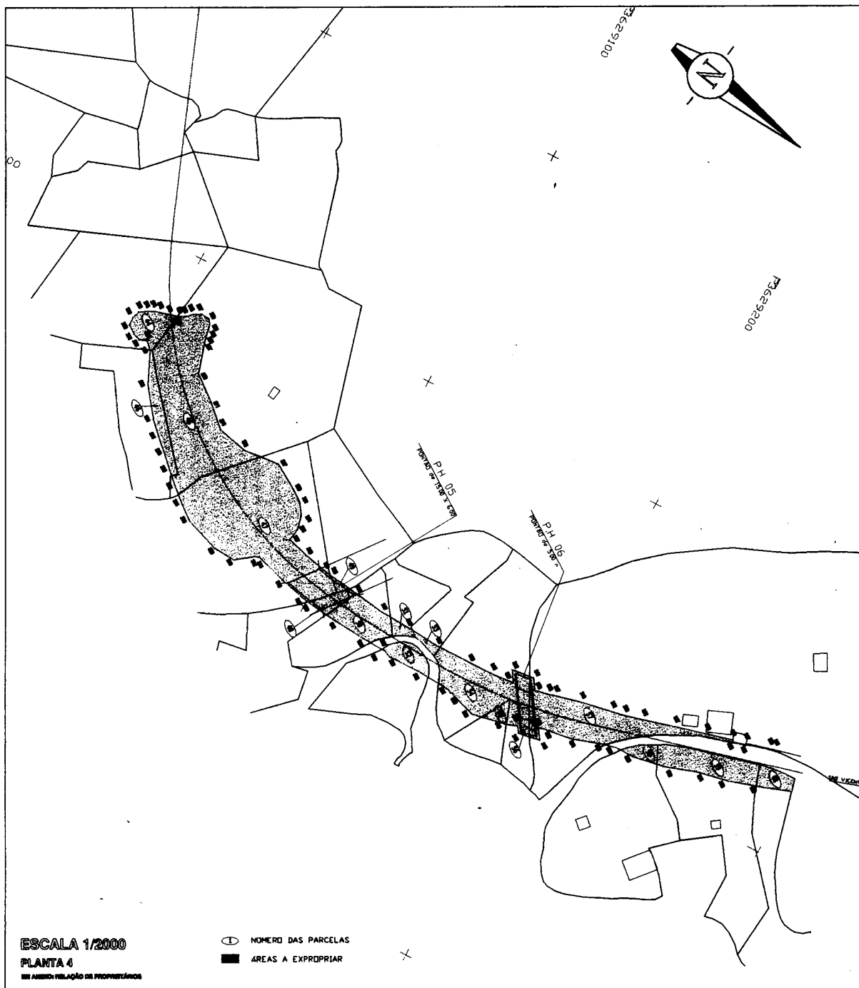
SECRETARIA REGIONAL DO EQUIPAMENTO SOCIAL E TRANSPORTES OBRA PÚBLICA DE CONSTRUÇÃO DA "VARIANTE À E.R. 104 - ROSÁRIO SÃO VICENTE - 1ª FASE"