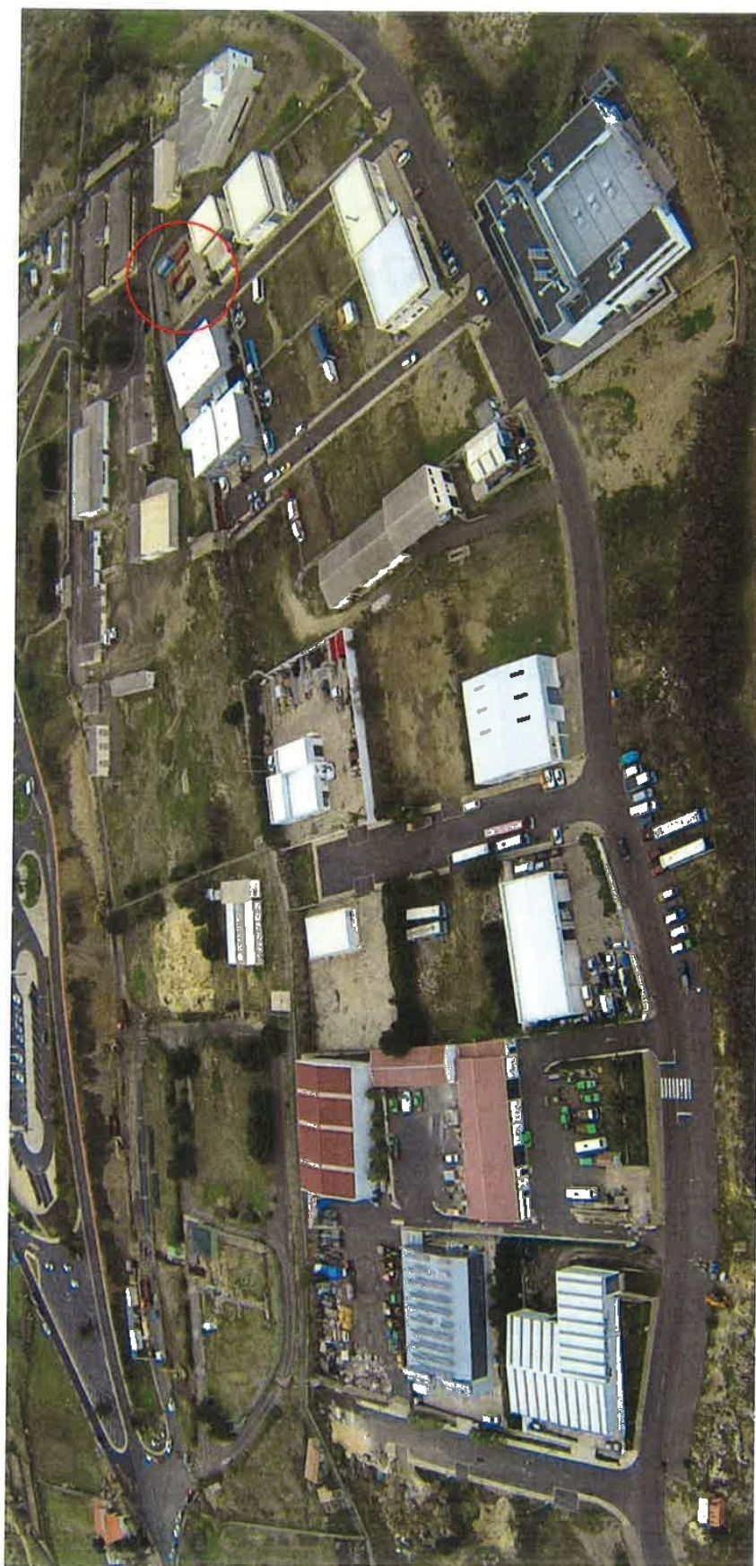
LOCALIZAÇÃO DO LOTE 15 DO LOTEAMENTO III