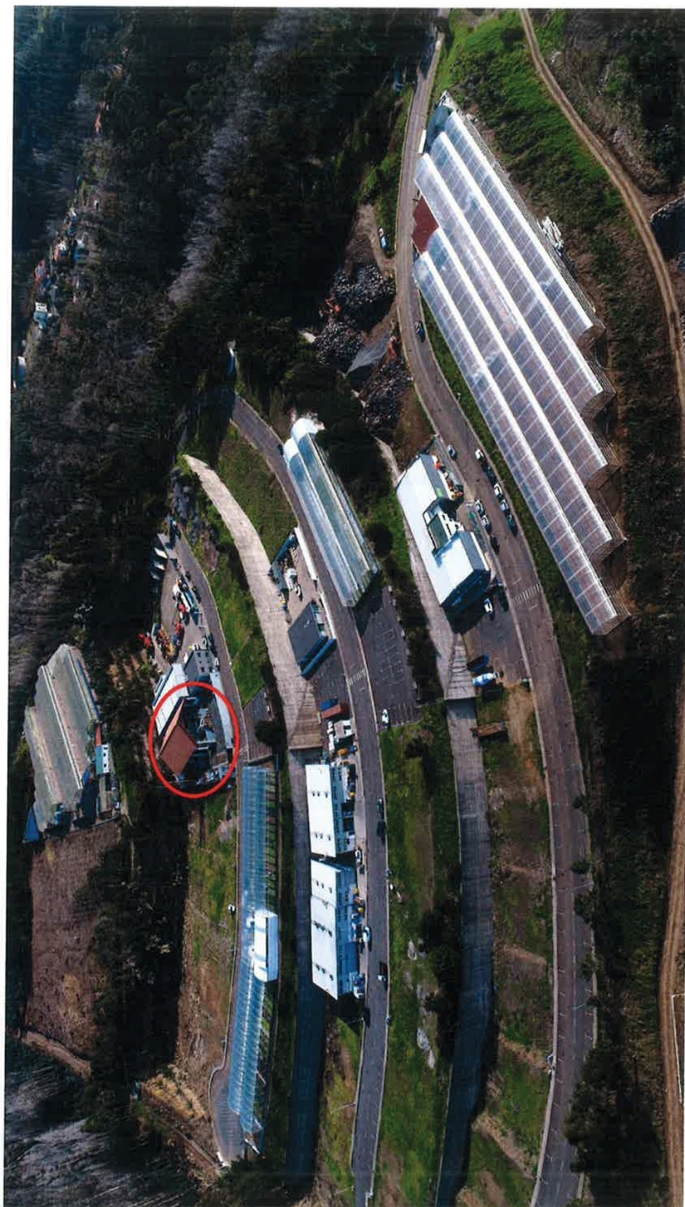
LOCALIZAÇÃO DO LOTE 53